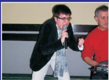
Vilić: Voli Šerifove pjesme