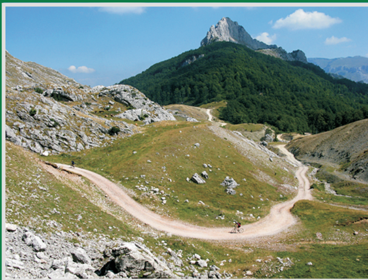
U BiH na planinski biciklizam

Britanska agencija Exodus počela je da organizira jednosedmična putovanja za brdske bicikliste koja počinju u Sarajevu, "koje spaja austro-ugarsku i otomansku kulturu sa današnjim avanturama". U okviru putovanja izdvajaju Lukomir kao najviše selo u zemlji te istraživanje regije oko masiva Prenj, "poznatog kao hercegovački Himalaji". "Država je uglavnom kopnena, ali Exodusova ruta uključuje nekoliko jezera, a kulminira penjanjem na vodopad sa vrištećim biciklističkim spustom od 4,200 stopa", piše National Geographic.