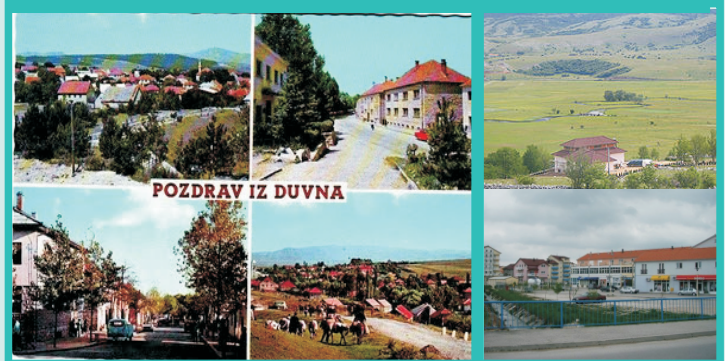
POZDRAV IZ DUVNA

Klima - Klima je veoma oštra, s vrlo jakim vjetrovima (bura i jugo), voda i tlo ne baš osobito darežljivi određuju i uvjetuju privrednu snagu Duvna i zanimanje njegovih stanovnika. Iako se rubom polja naokolo steru oranice, na kojima uspijevaju sve vrste žitarica, krompir, kupus i druge vrste povrća. Duvno je pašnjak, kako mu kaže i njegovo ilirsko ime. Planine - pašnjaci, gotovo polovina polja - livade, omogućivale su u dalekoj i ne tako dalekoj prošlosti prehranu i uzgajanje velikog broja sitne i krupne stoke.