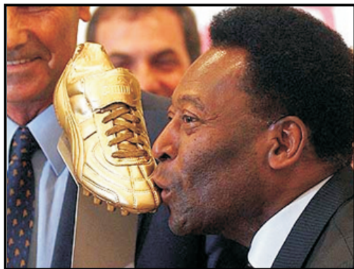
Najboljih strijelaca svih vremena: Pele

"Upad" na zabavu koštat će 1000 dolara po osobi a sav novac ide u zakladu za poboljšanje Centra. _____ Totalsport